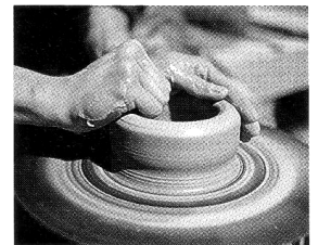
Gott ist der Töpfer, wir der Ton. Seine Wege sind unbegreiflich! können ihn nicht gereuen“ (Röm 11,29), das stellt Paulus unmissverständlich klar.

1. Dem Volk Israel gehört „die Kindschaft... und die Herrlichkeit und der Bund und der Gottesdienst und die Verheißungen“ (Röm 9,4). Daran hat sich bis heute nichts geändert und das wird auch für immer so bleiben. Denn „Gottes Gaben und Berufung können ihn nicht gereuen“ (Röm 11,29), das stellt Paulus unmissverständlich klar.